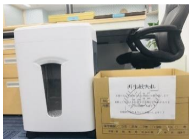
一般廃棄物の分別