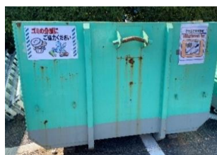
産業廃棄物の分別BOX