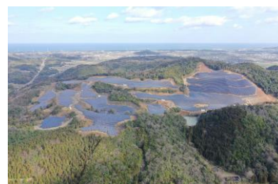
鳥取県内太陽光発電所建設工事