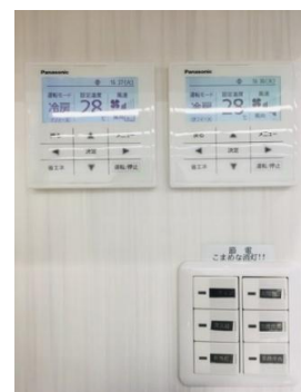
エアコンの適切な温度管理